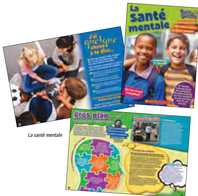
La santé mentale